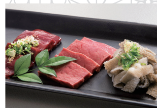
刺身3種盛り合わせ