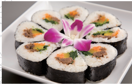
きんぱ 韓国風 海苔巻き