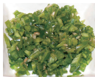
青唐辛子のきざみ