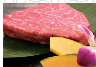
シャトーブリアン