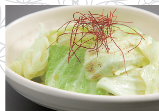
やみつきキャベツ