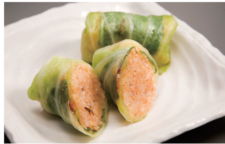
茹でキャベツのおにぎり