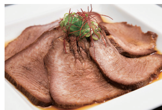
牛タンのピリ辛醤油煮