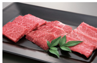
上 三種盛り合わせ